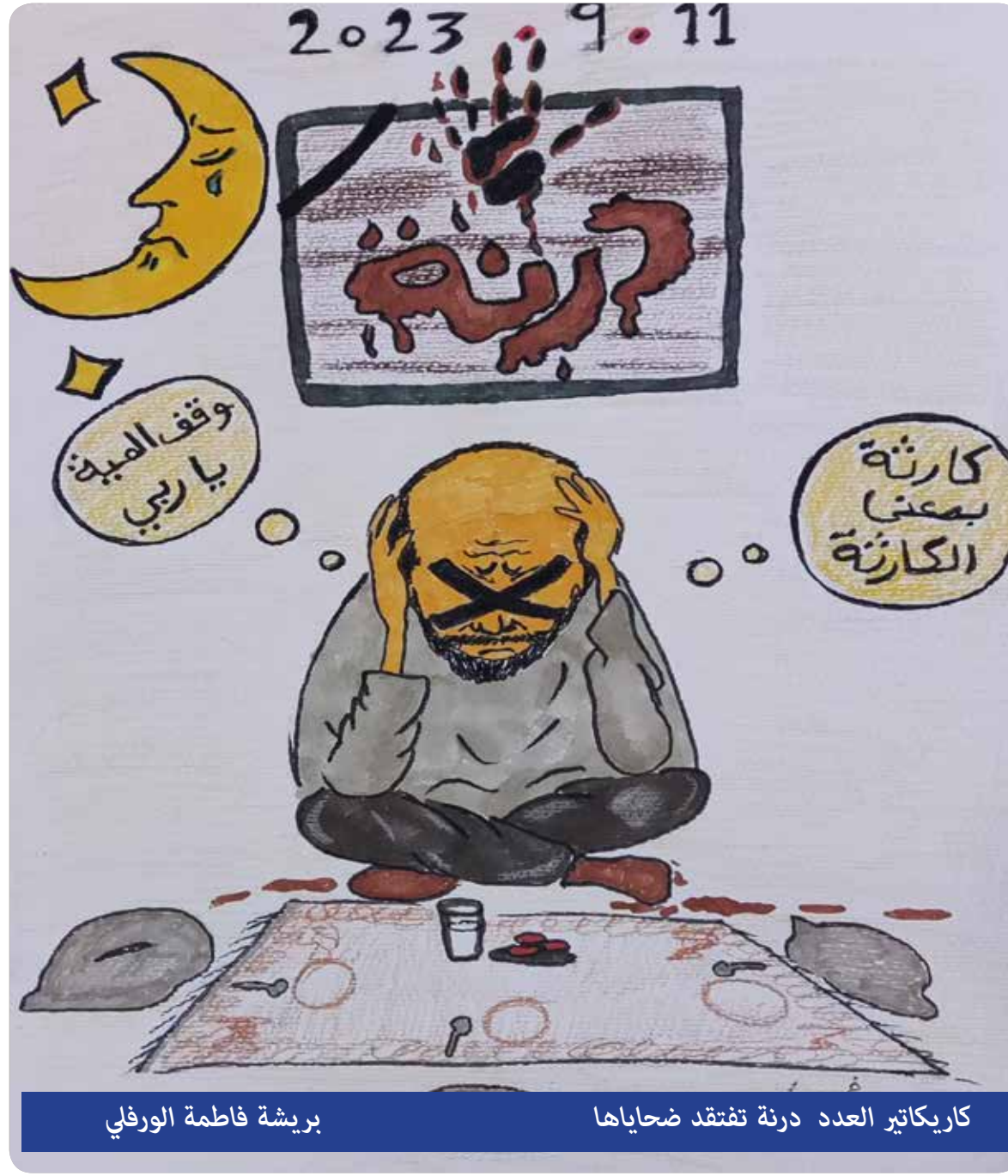
بريشة فاطمة الورفلي

إن الغزبان والغزبان الذين أفضلوا بالدماء والصوم مخططات أمريكا لجعل القضية الفلسطينية في طي النسيان وهامش التاريخ، ليسوا في حاجة البتة إلى شعور حكامنا بالألم وإلى دعاء أمتنا ... فليكن رمضان بلا دعاء ولا تبريكات ... لنصم ونصمت.