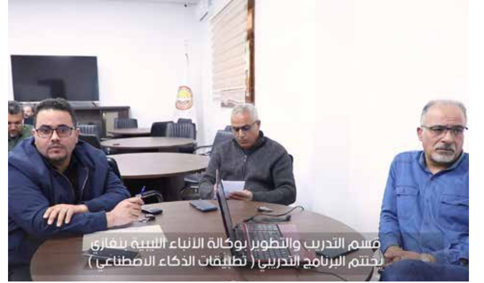
قسم التدريب والتطوير بوكالة الأنباء الليبية ببغازي يختتم البرنامج التدريبي ( تطبيقات الذكاء الاصطناعي )

التدريبية حول «تطبيقات الذكاء الاصطناعي في المجال الإعلامي»، والتي نظمتها قسم التدريب والتطوير بوكالة الأنباء الليبية لموظفي المكاتب الإعلامية