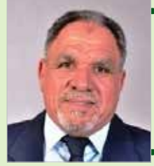
بقلم الكاتب الصحفي: مصطفى فنوش

نشأ معا في بيت واحد تربطه جسور الود والمحبة بينهم منذ الطفولة وكبرت عواطفهم مع الأيام وتعاهدا على مواصلة رحلة العمر معا.